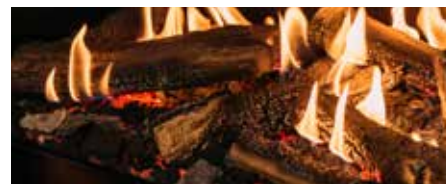
Moduł świetlny HPL